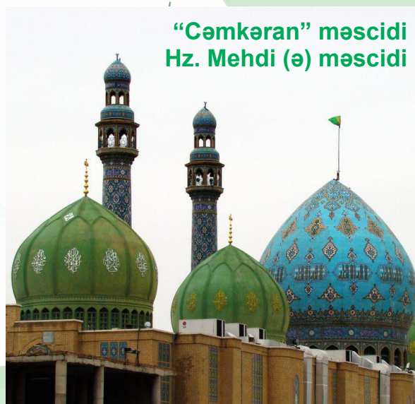
“Cəmkəran” məscidi Hz. Mehdi (ə) məscidi

Əhli-beyt (ə) barədə buyruqları və tövsiyələrinə məhəl qoymayan İslam hakimiyyətini ələ keçirmiş zamanənin xəlifələri məsum imamları biri-digərinin ardınca qətlə yetirmişlər. Əgər imam Zaman (ə) da zühur etsəydi, şübhəsiz, öz əcdadının sərgüzəştinə məruz qalacaqdı. Lakin bu cinayətin qarşısını alıb, bütün ümmətlərə vəd etdiyini (müstəzəflərin yer üzünün varisi olacağı, yer üzündə haqq-ədalətin bərpa olacağını) həyata keçirmək üçün Allahın hikməti bunu tələb edir ki, bəşəriyyət belə kamil insanın öz arasında qəbul edə biləcək istedadına yiyələnməyənədək onu gözlərdən gizli saxlasın. İmam Zamanın (ə) pərdə arxasında olmasına səbəb hakimlərin zülmü və camaatın belə bir şəxsiyyəti qəbul etməyə hazır olmadıqlarıdır. Aşağıdakı